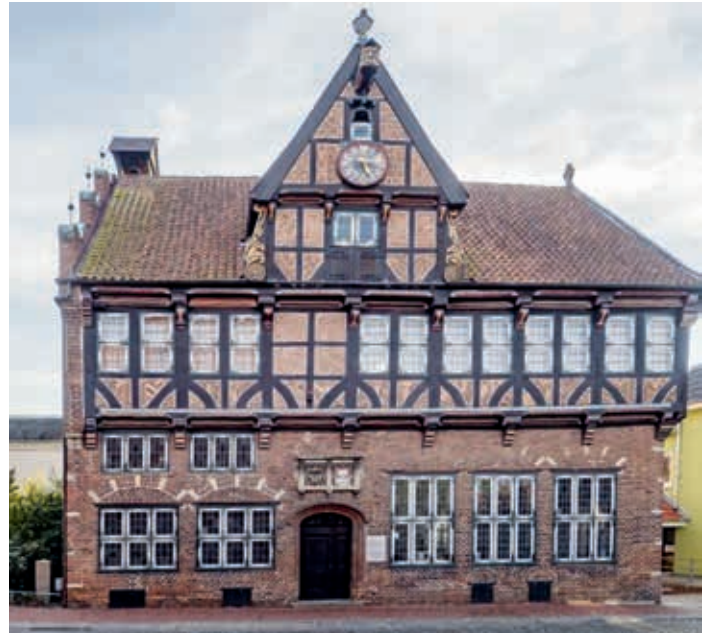
Altes Rathaus Wilster

Zum Abschluss besuchen wir den Mühlenspeicher der bekannten Mühle „Aurora“, dort gibt es dann selbstgebackenen Kuchen und Kaffee oder Tee.